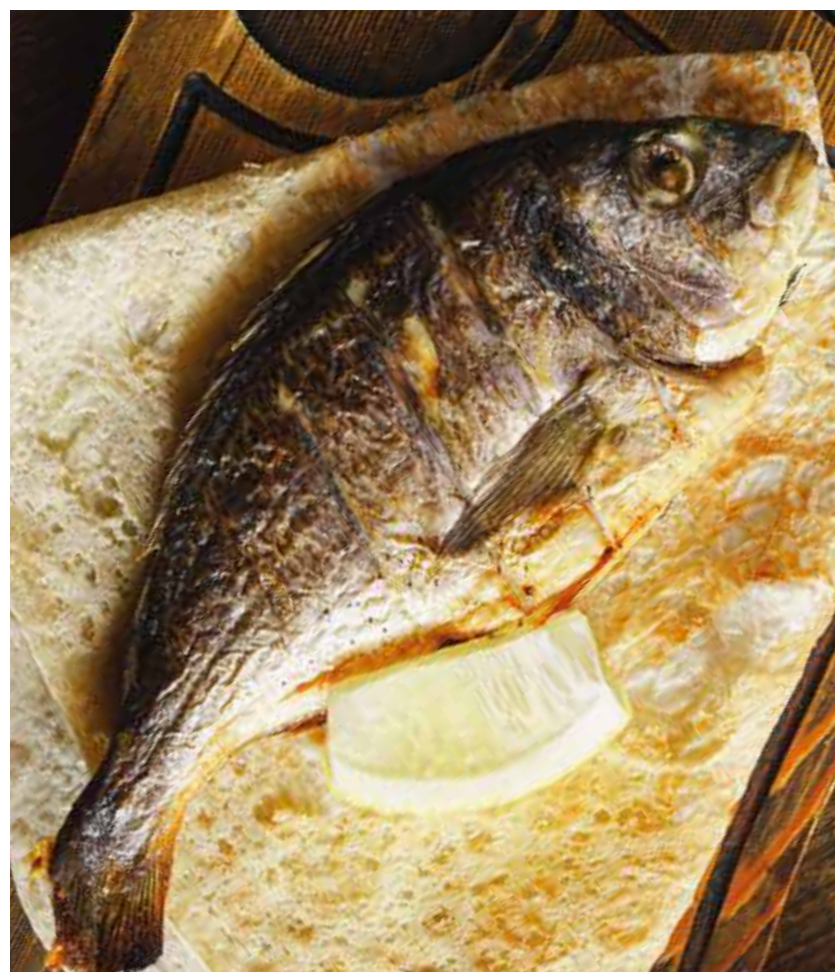
ДОРАДО В КАВКАЗСКИХ ТРАВАХ