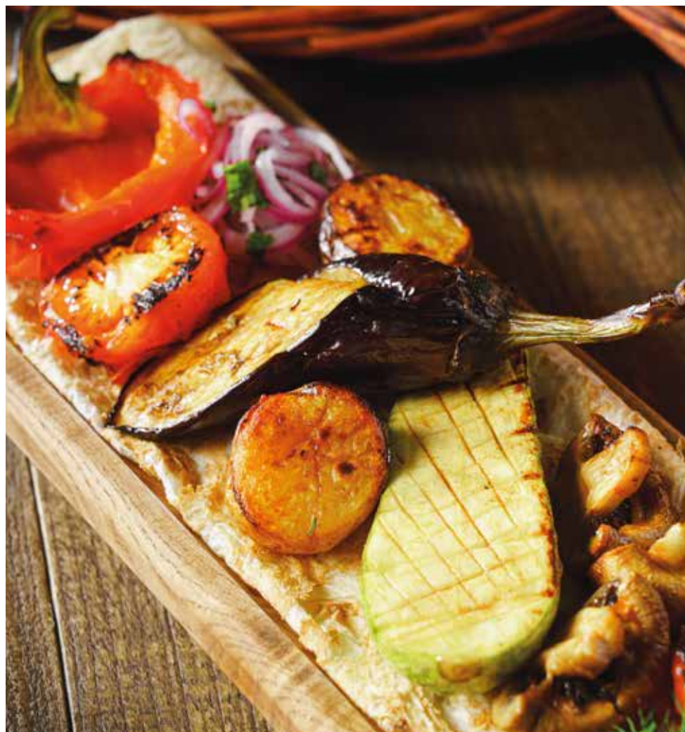
МИКС ОВОЩЕЙ 455 Vegetable skewer 1/330