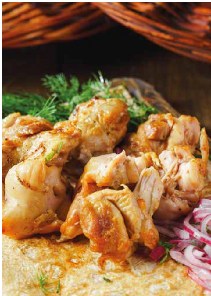
КУРИНОЕ БЕДРО 255 Chicken thigh barbecue за 100 гр