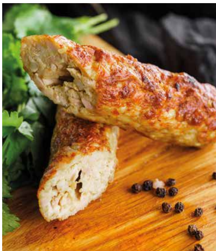
КЕБАБ ИЗ КУРИЦЫ