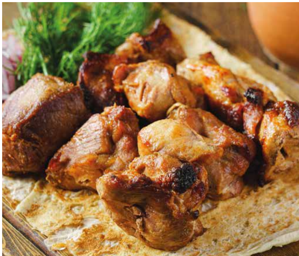
МЯКОТЬ СВИНИНЫ 285 Pork barbecue за 100 гр